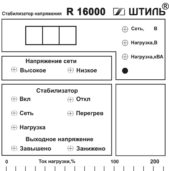
Рис.1. Внешний вид передней панели стабилизатора

Шкала индикаторов “Ток нагрузки,%” показывает величину тока подключенной к стабилизатору нагрузки в процентах от допустимого значения.